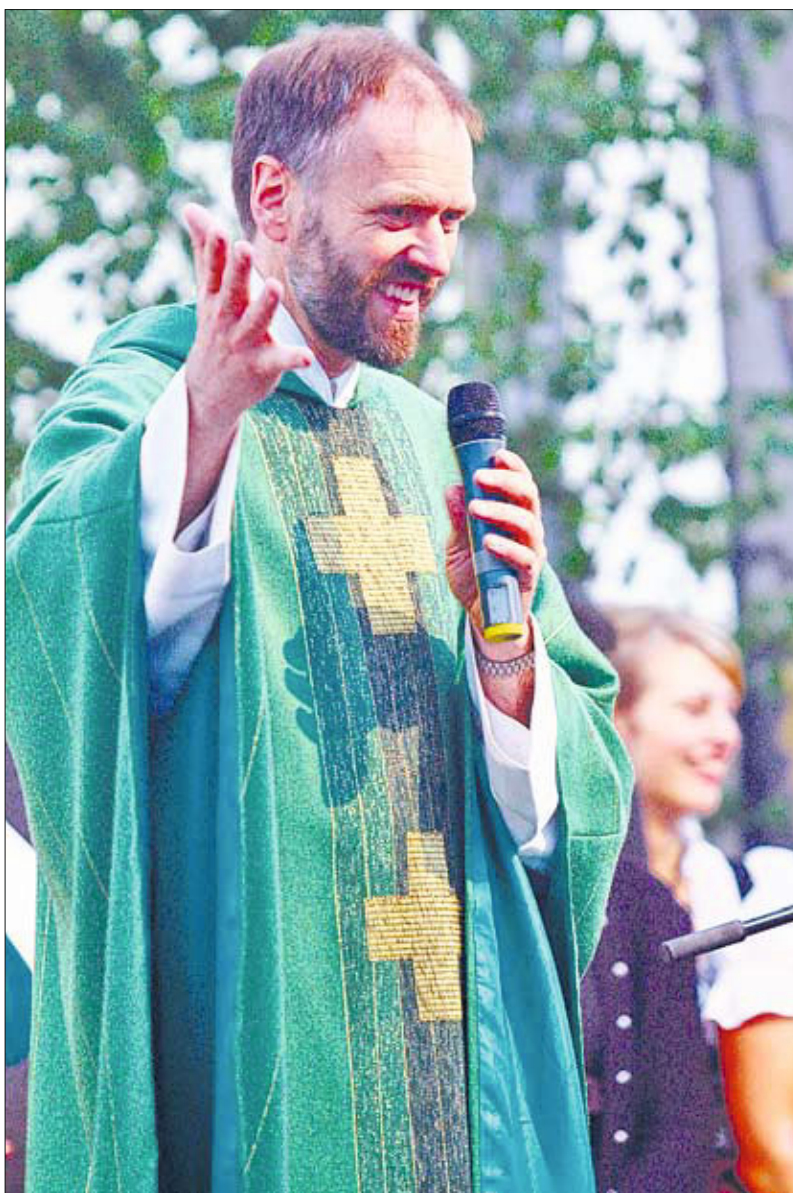
Pater Benedikt möchte eine Sprache finden, in der sich die Generationen untereinander über Glaubensfragen verständigen können.

Hinzu kommen unsere ganz persönlichen Fragen, wie die Verarbeitung von Leid. Und das Ganze auf dem dünner gewordenen Fundament einer schwindenden Glaubenspraxis. Bei uns leben