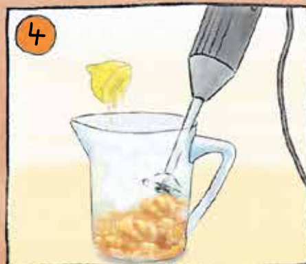
4 Äpfel zu Mus pürieren und mit Zitronensaft abschmecken.