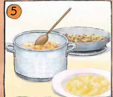
5 Beides vermengen, mit Speck und Zwiebeln anrichten.