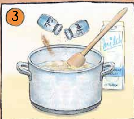
3 Kartoffeln abgießen, stampfen, Milch unterrühren und würzen.