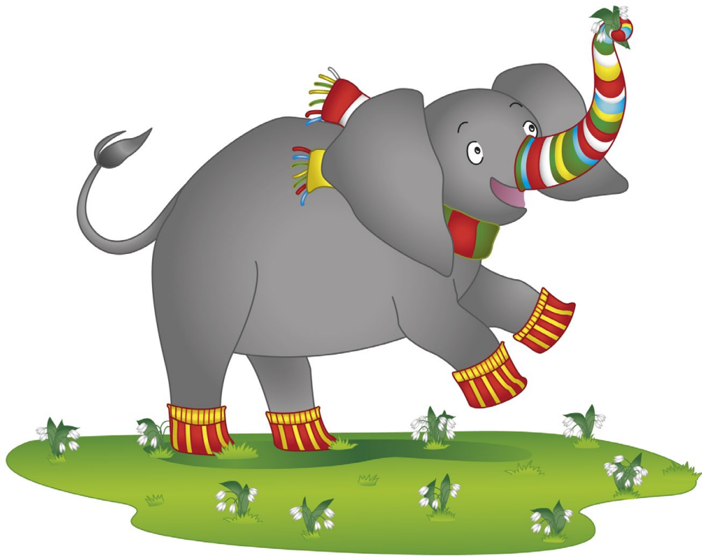
Illustration: Karina Grünwald